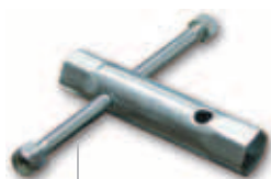
Sleutel voor ontgrendeling