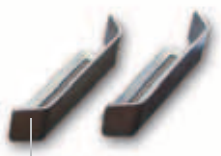
Eindschakelaarbeugels voor FIBO 300 en FIBO 400